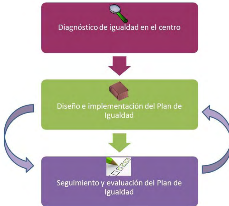
Ilustración 1: Diagrama con las fases del proceso de elaboración de un plan de igualdad.

El diagrama que aparece a continuación representa el proceso de elaboración del plan de igualdad, para el que se proponen 3 fases principales: