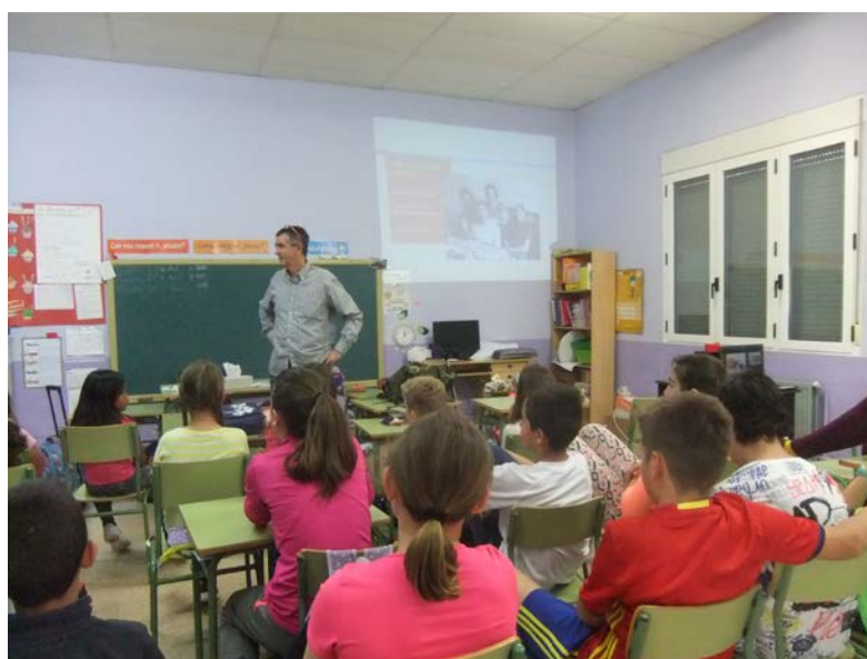
Una colaboración en la escuela pública de Lupiñén durante el curso 2018-19 (Huesca)

Los trabajos se engloban en cuatro bloques que van desde los comienzos del siglo XX, con ecos de la salida del Antiguo Régimen, hasta el actual periodo democrático, pasando por la II República, la Guerra civil, y el Franquismo.