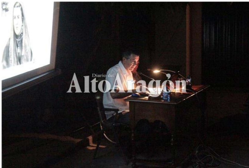
Presentación en "Las Noches Mágicas" (Instituto de Estudios Altoaragoneses) del trabajo "Siente. Testimonios de aquel Pirineo" (Huesca, agosto, 1917)

No era un estudio localista pues, desde una escuela concreta, la de Caldearenas (Pirineo oscense) y su entorno, pretendía dar a conocer el devenir y las esencias de la escuela rural española.