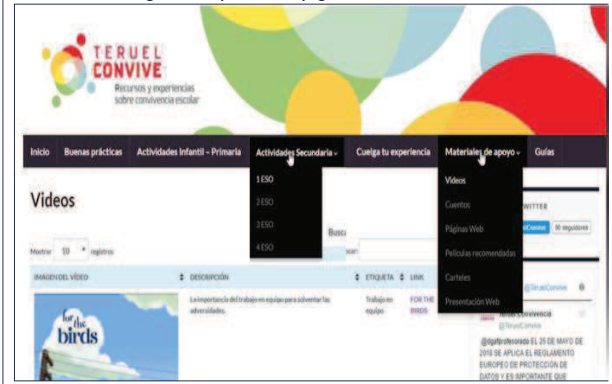
Figura 3.- Esquema de la página web Teruel Convive.

Autor del logotipo Carlos Fuertes Abril. Alumno de la Escuela de Arte de Teruel.